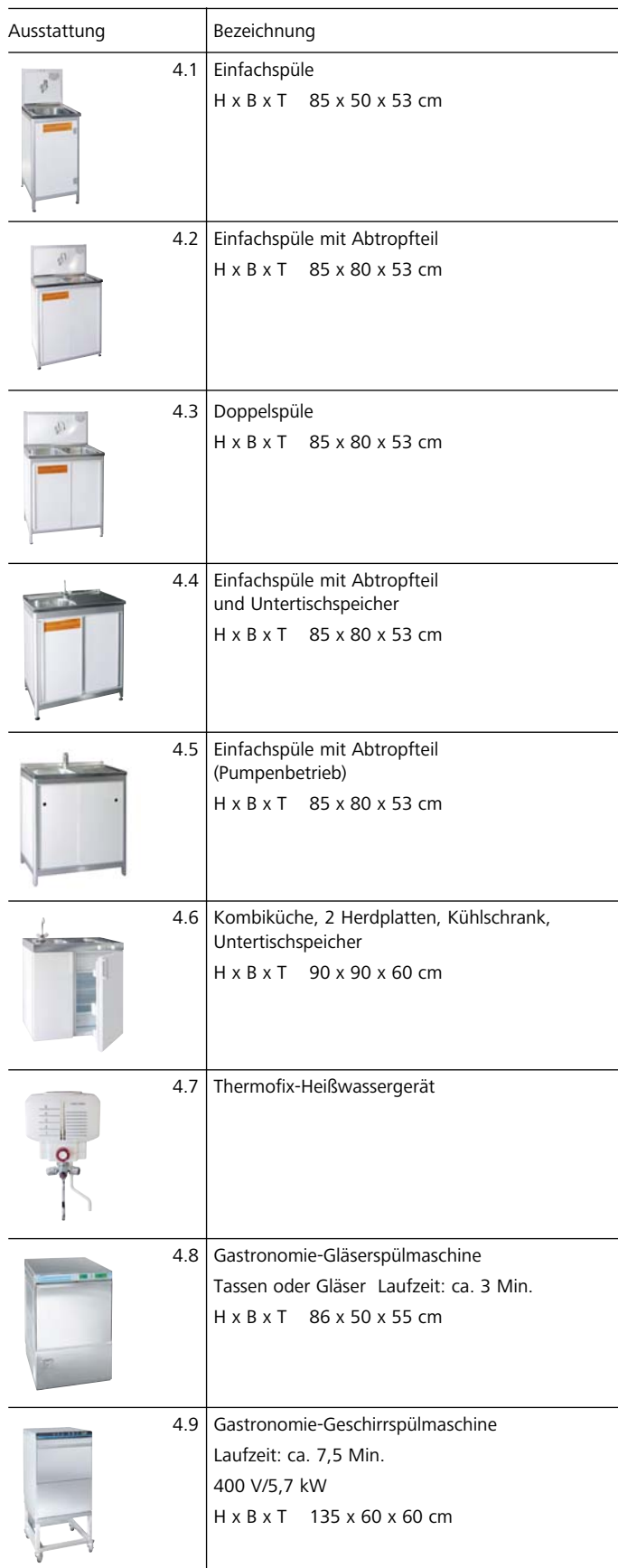
Illustration der Mietgeräte